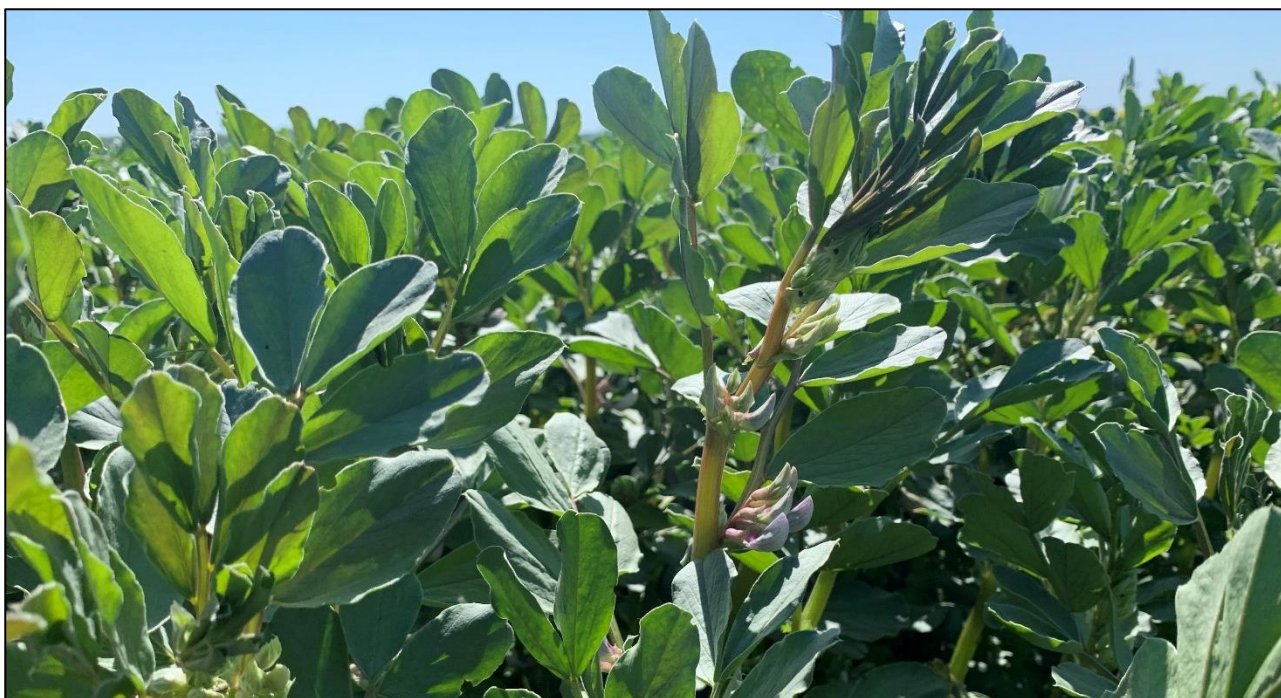
Figur 1. Vinterhestebønne i blomst på Lolland 12. maj 2023.

Hestebønnerne udgør en god vekselafgrøde. Den opsamler kvælstof fra luften, og har derfor en god forfrugtsværdi. Den bør af samme årsag placeres et sted i sædskiftet hvor der er mindst kvælstof til rådighed. Planterne behov for P og K dækkes af jordens reserver. Har man sandjord kan gødskning med svovl eller kalium være nødvendigt.